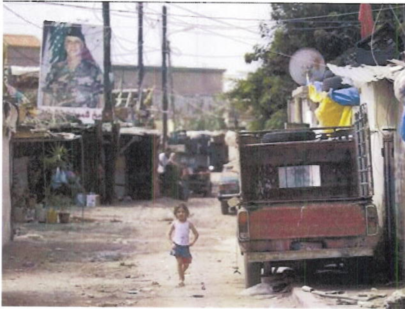
في طرابلس.. حيث 64% من الأسر محرومة اقتصادياً (م. ع. م.)

□ طرابلس وحلب ونواكشوط: نماذج عن الفقر الحضري العربي.. والتدخلات