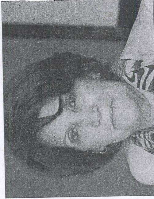
Masri says it is time for the U.N. to recognize the Palestinian people's rights.

Social affairs minister says refugee issue will remain an integral part of the peace process