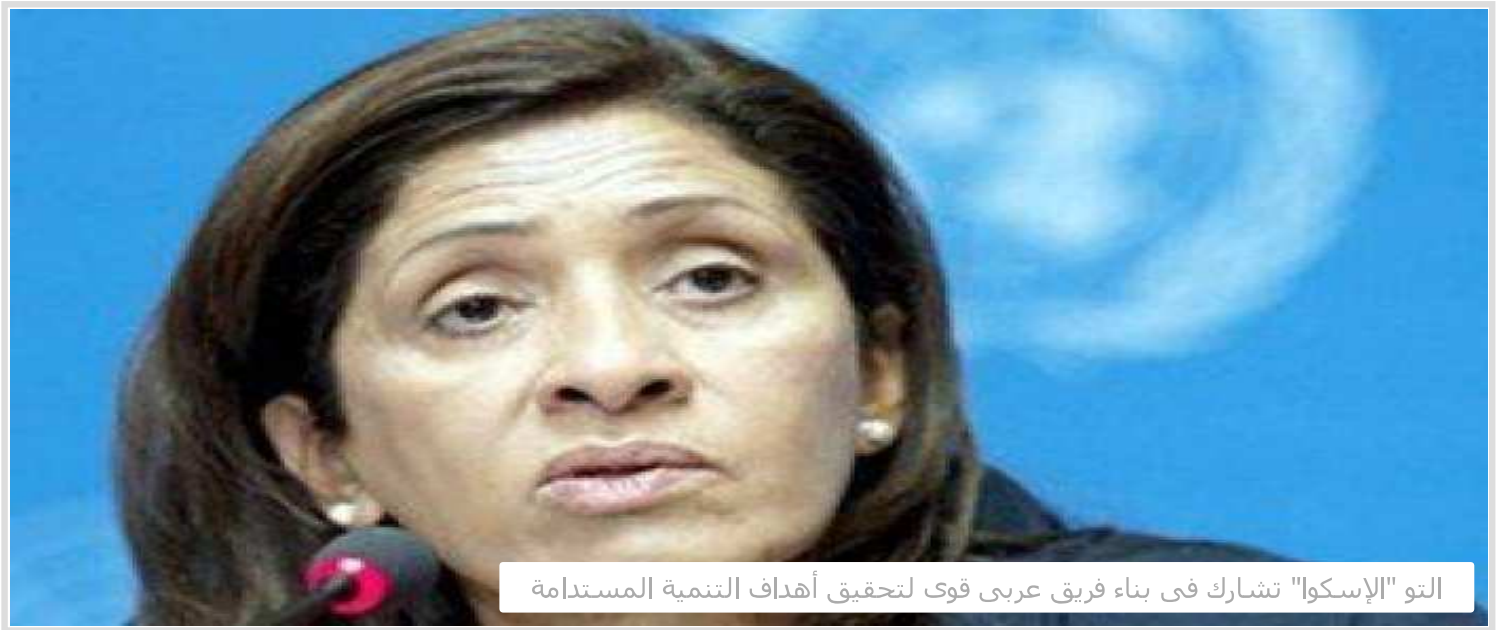
التو "الإسكوا" تشارك في بناء فريق عربي قوى لتحقيق أهداف التنمية المستدامة

منذ يومين ٠ شرين مذكور ٠ اخبار عربية ٠ تبليغ ٠ حذف