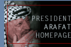
العام الأول على رحيل القائد الرمز المعلم الرئيس أبو عمار