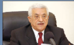
رئيس السلطة الوطنية الفلسطينية

التقرير الأسبوعي ثلاثهاكات الإسرائيلية منذ قمة شرم